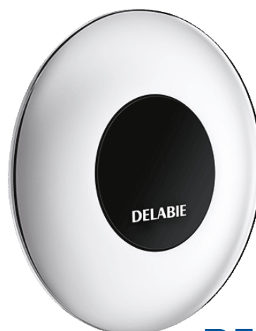
Tempomatic direkt flush Best. nr: 463 030

Kan ikke anvendes i rum med temperatur på under 10°C.