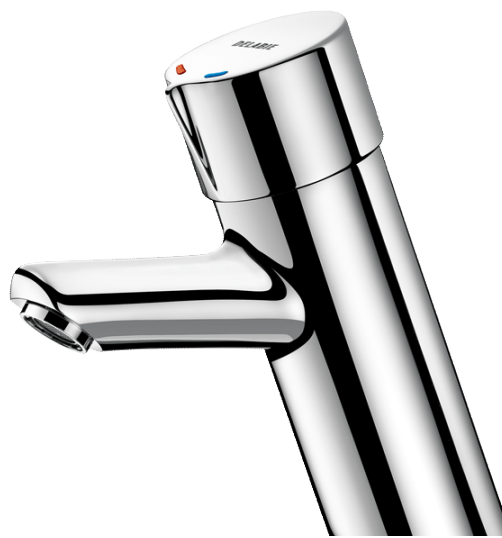
Tempomix 795 100 V2