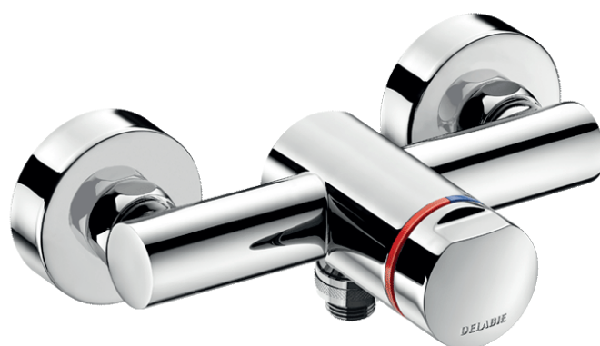
Tempomix 3 brusebatteri Best. nr: 794 470