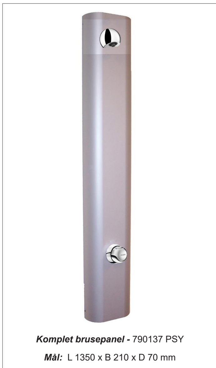
Komplet brusepanel - 790137 PSY