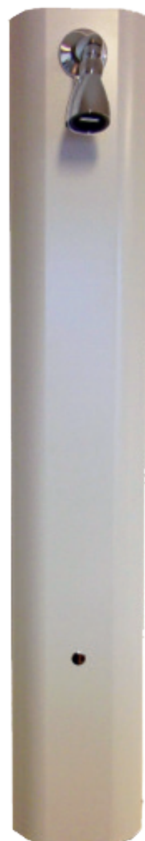
Model 749 535

Ønskes anden ståhøjde under bruseren reguleres monteringshøjden målt fra gulv i forhold til de 2130 mm.