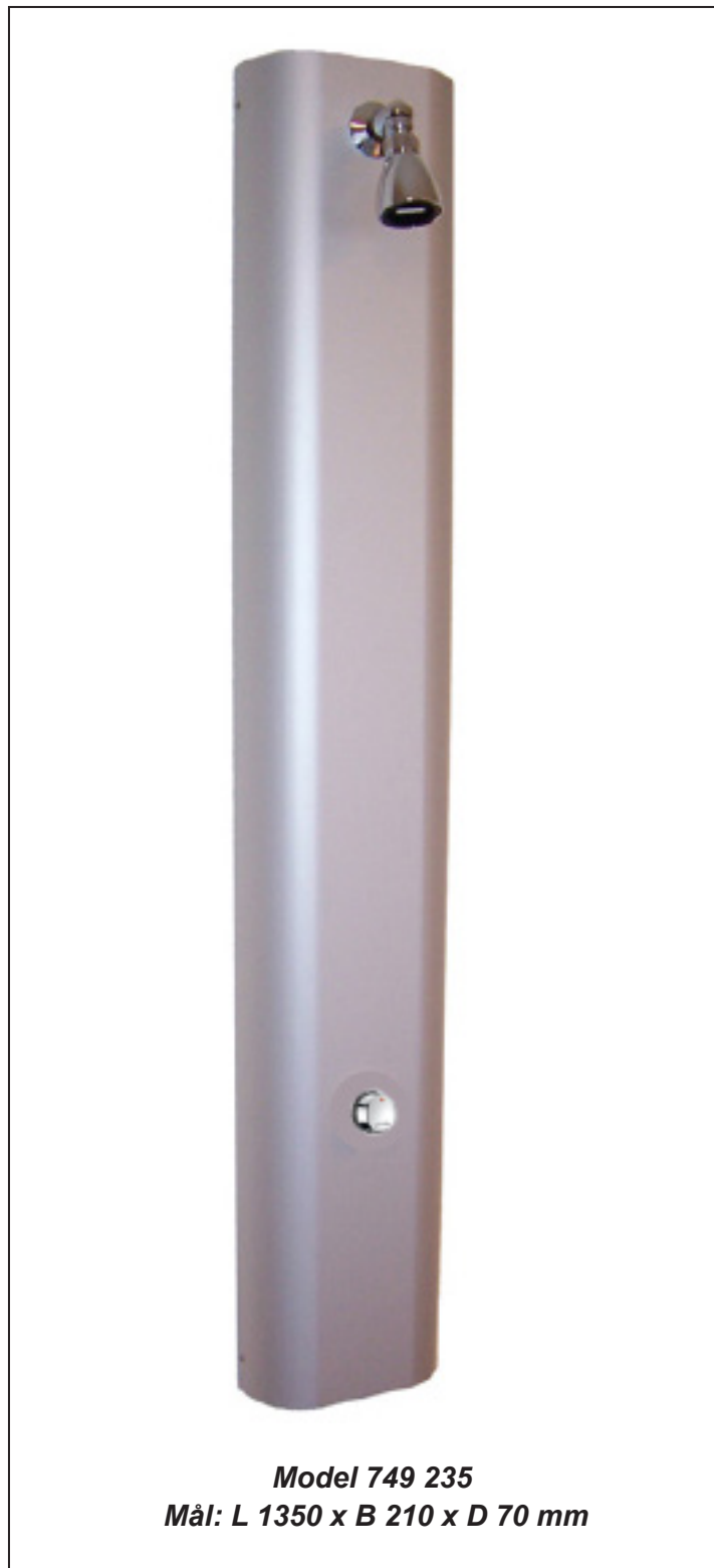
Model 749 235 Mål: L 1350 x B 210 x D 70 mm

En kollektiv installation skal kunne repareres og vedligeholdes hurtigt. Vi anbefaler derfor, at man har et par komplette indsats på lager med henblik på, at man hurtigt kan skifte ventilindsatsen og få anlægget til at køre på ny. ( Indsats 743743 - Skylletid 30 sek. )