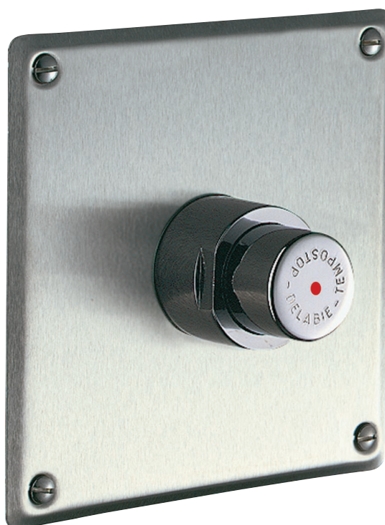
Bruseventil for indbygning - Model 749 628 VVS-Nr: 72 3857.004

Vandforbrug ca. 6 liter/minut - Kan reguleres.