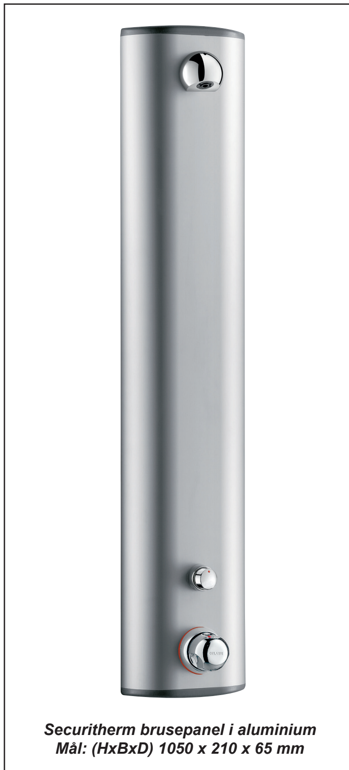
Securitherm brusepanel i aluminium Mål: (HxBxD) 1050 x 210 x 65 mm

Placering af vandudtag (f.eks koblingsdåse) anbefales placeret i en højde over færdigt gulvniveau på ca. 165 cm dette vil give en ståhøjde under bruseren på ca. 205 cm.