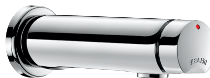
Temposoft 2 tappeventil Best. nr: 741 500 - VVS-nr: 74 2333.500

Af hensyn til skoldningsrisiko anbefaler vi, at fremløbstemperaturen på det forblandede vand ikke er højere end 38-41° C.