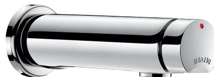
Temposoft 2 tappeventil Best. nr: 741 550 - VVS-nr: 74 2333.500