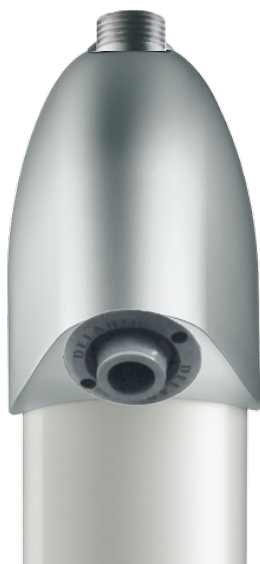
Tempostop brusepanel med jet dyse Best. nr: 714 700 CMA