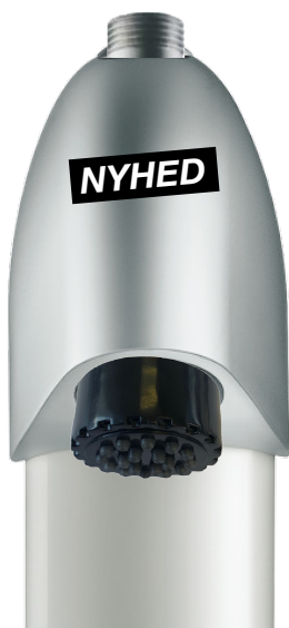
Tempostop brusepanel med egro komfort med gummidyser Best. nr: 714 700 / 142