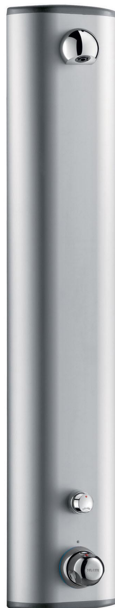
Securitherm brusepanel i aluminium Mål: (HxBxD) 1044 x 210 x 66 mm

Placering af vandudtag (f.eks koblingsdåse) anbefales placeret i en højde over færdigt gulvniveau på ca. 165 cm dette vil give en ståhøjde under bruseren på ca. 205 cm.