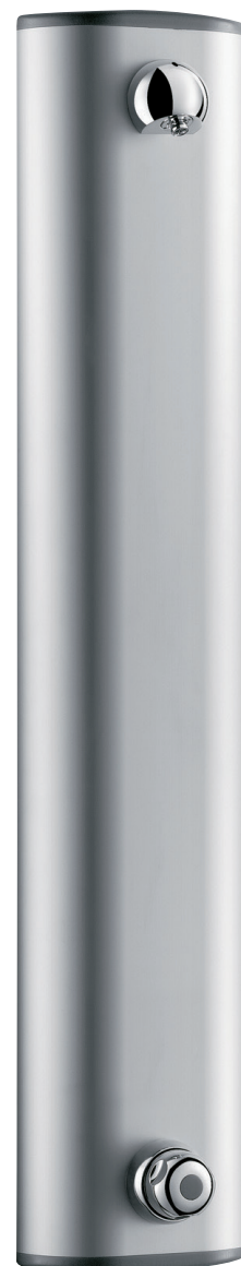
Tempomix brusepanel i aluminium Mål: (HxBxD) 1044 x 210 x 66 mm

Placering af vandudtag (f.eks koblingsdåse) anbefales placeret i en højde over færdigt gulvniveau på ca. 165 cm dette vil give en ståhøjde under bruseren på ca. 205 cm.